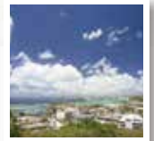
○スカイダイビング