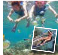
シュノーケリング 20$ クリアカヌー 35$